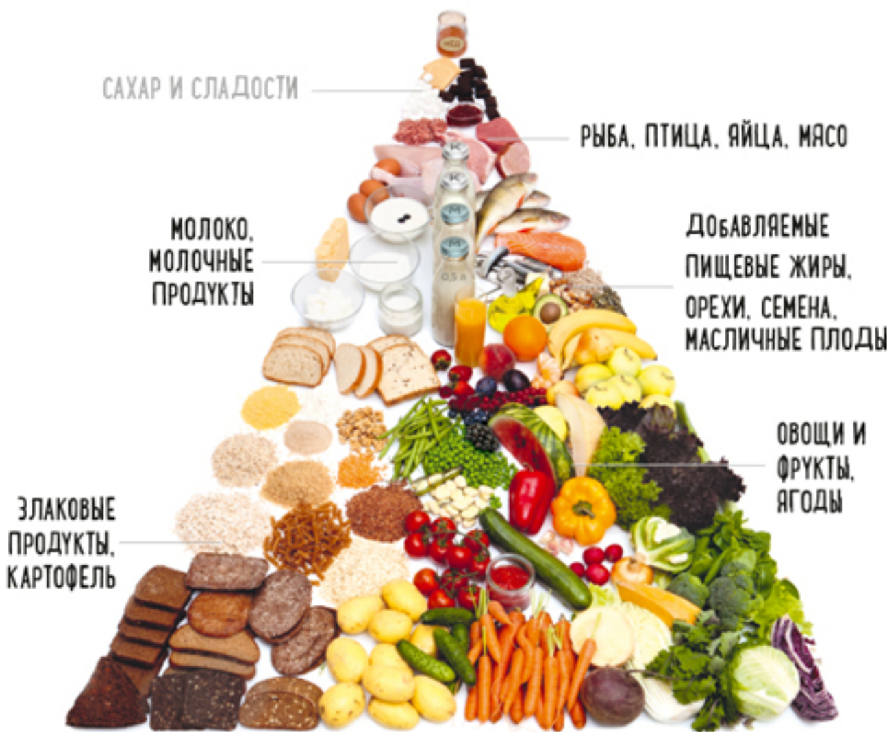
Примерное количество пищи на неделю в расчете на энергетическую потребность 2000 ккал