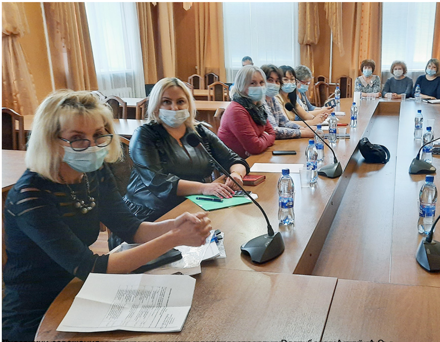
Министерство здравоохранения Республики Агартә, Республика Агартә