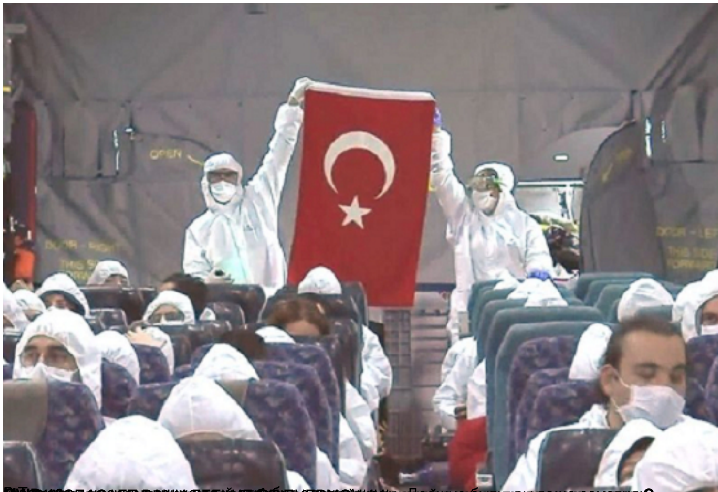
Видеоролик, сделанный в формате 4K, показывает, что в режиме видеонаблюдения