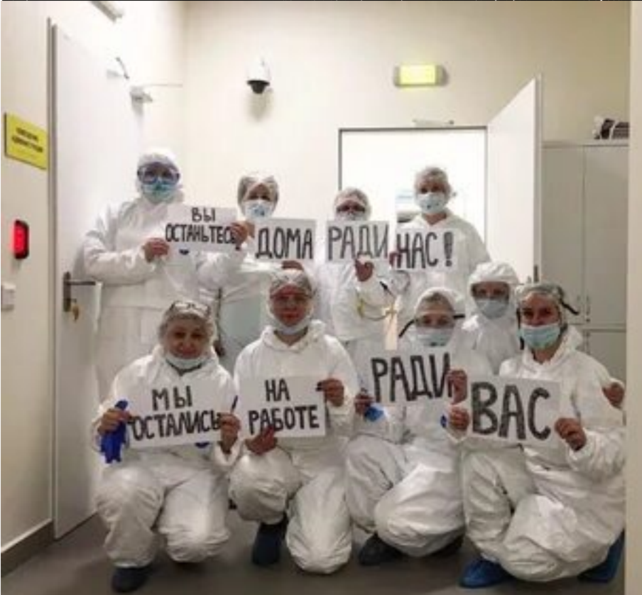
Поблагодарите медиков и коллег по работе и присоединитесь к их просьбе: сделаем всё,