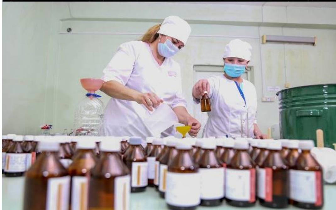
МАСКИ И ВИТЫ В МАГАЗИНАХ ЗАВАЗИТЬ СЛОЖНО