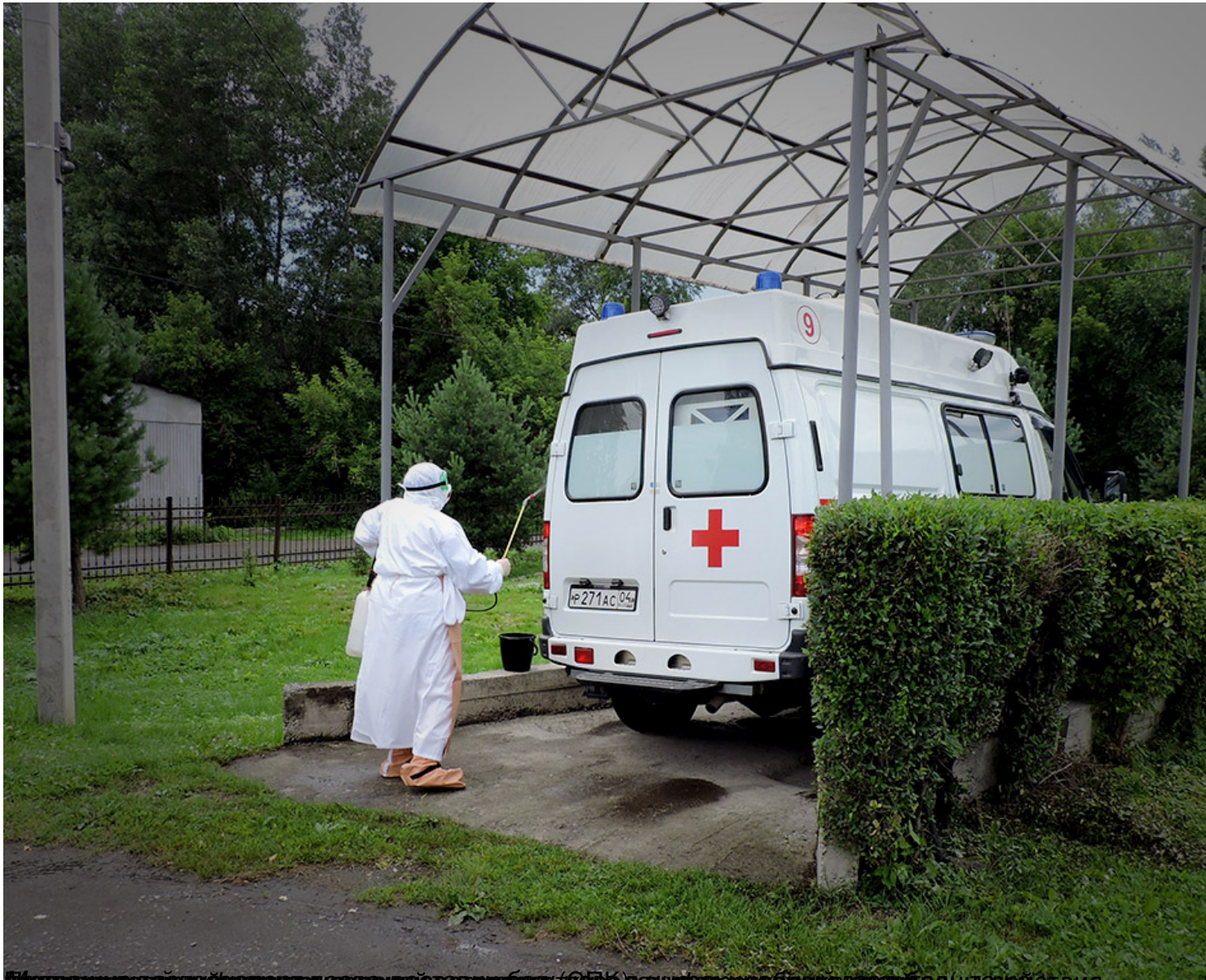
Служба санитарно-эпидемиологического надзора (СЭН) г. Горно-Алтайска проводит учения по чуме