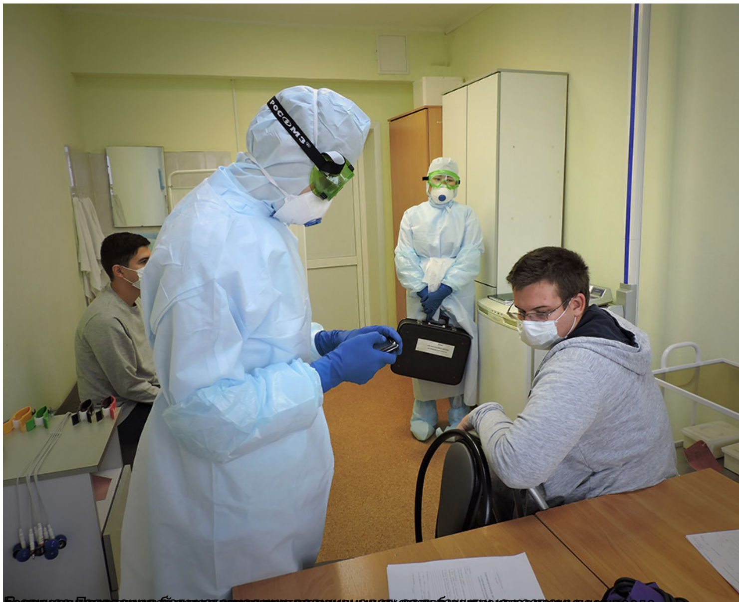
Баруцаде Прата ансяабуо везадакнелсуз ваджкнииде вхса блвипуке лави са дашагыбсле