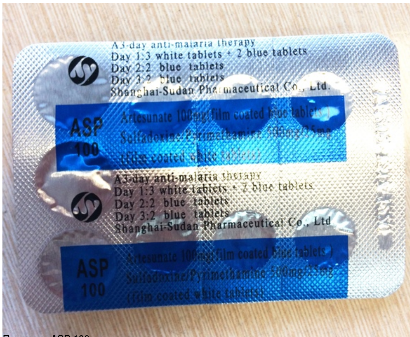
Препарат ASP 100