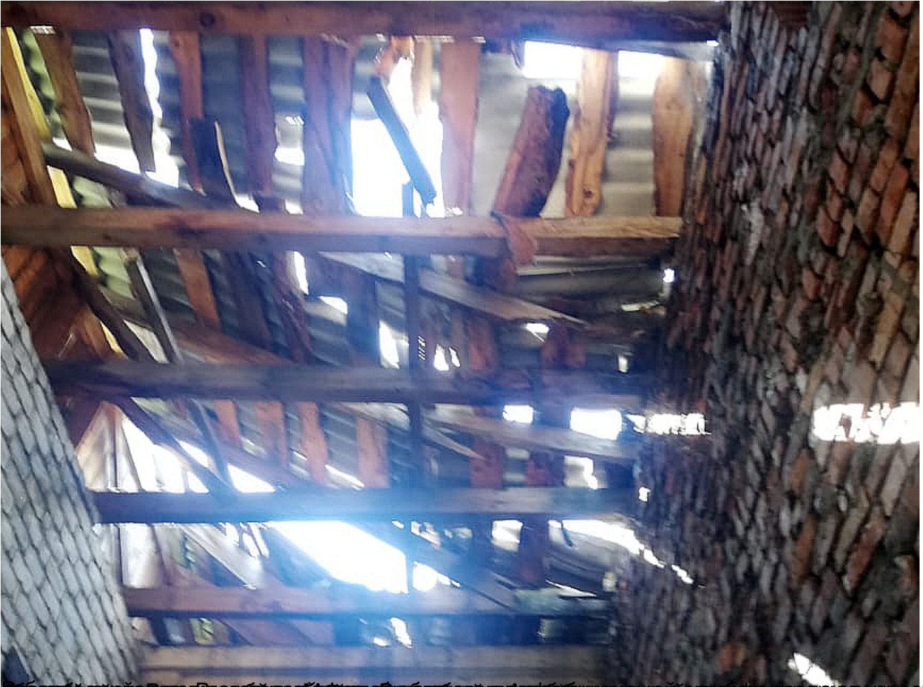
Вид изнутри помещения, поврежденного в результате обрушения кровли, угрозы