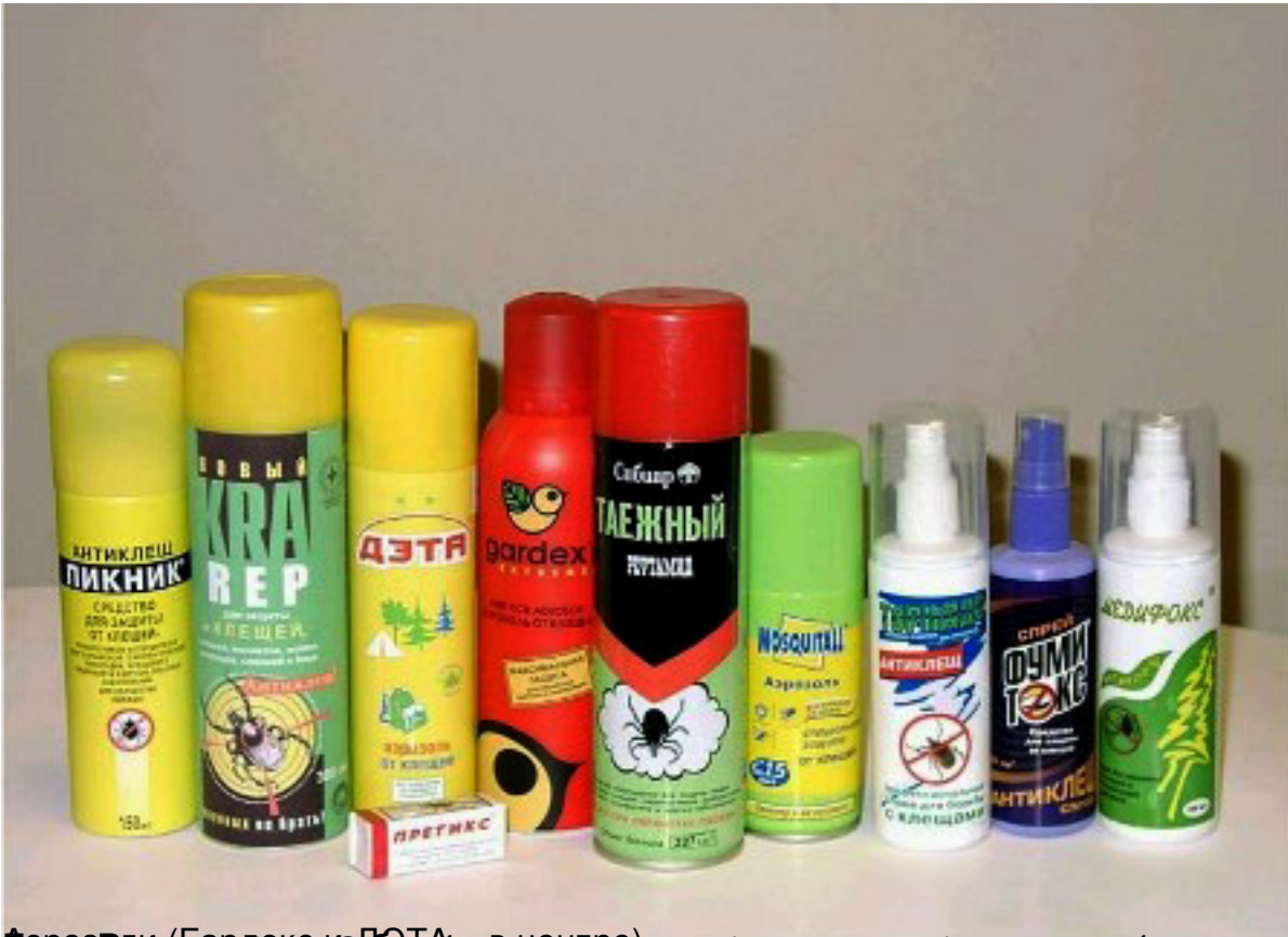
кассеты (Борнео, ДЭТА, сибирь, таежного) удачения без паразитов клещей