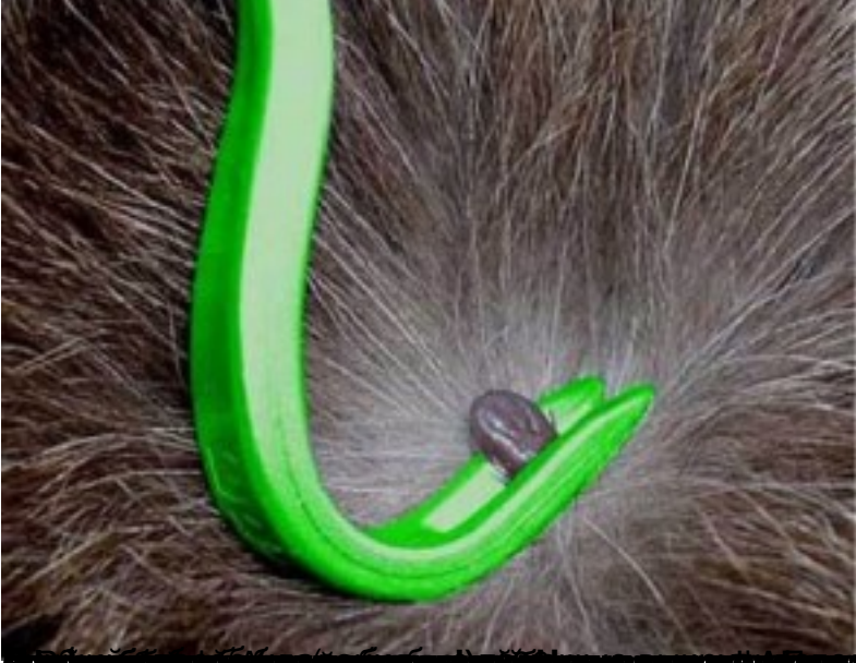
кассеты (Борнео, ДЭТА, сибирь, таежного) удачения без паразитов клещей