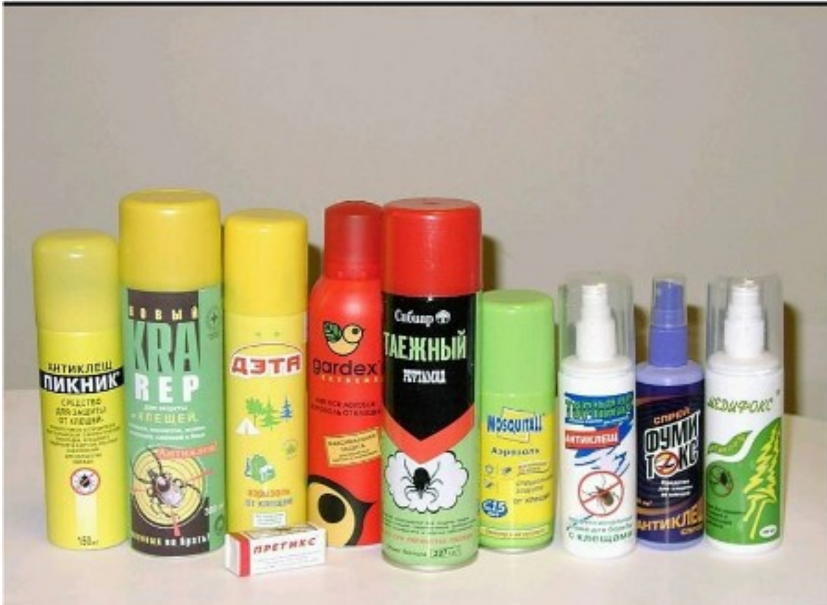
Наилучшие средства все же действуют «Пикник», «Гардекс» и «ДЭТА» (с пометкой